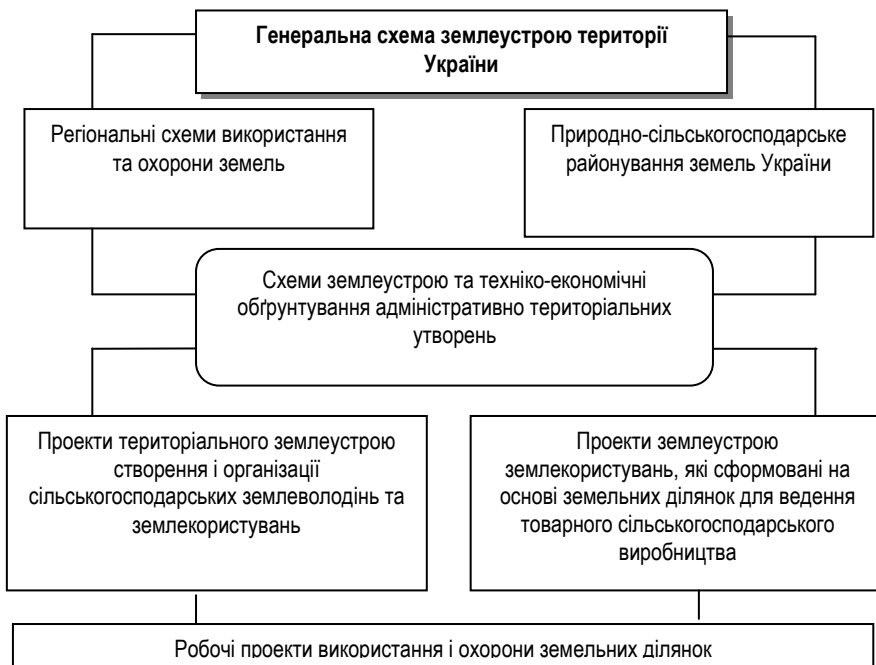
Рис. 2. Система землевпорядного забезпечення при плануванні сільськогосподарського землекористування*

сільськогосподарського призначення і здійснення заходів з планування та організації раціонального використання цих земель, необхідно внести зміни до концепції «Державної цільової програми розвитку земельних відносин в Україні на період до 2020 року» [8]. Ця програма повинна передбачати здійснення землеустрою на землях, що використовуються в сільськогосподарському виробництві, в тому числі на землях, що перебувають у державній власності.