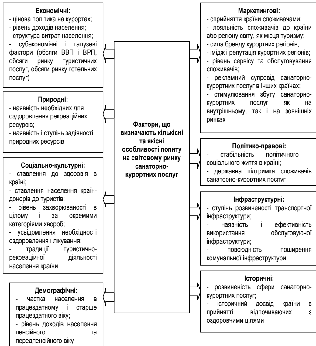
Рис. 3. Система факторів, що визначають кількісні та якісні особливості попиту на ринку санаторно-курортних послуг*

Попит на ринку санаторно-курортних послуг формується залежно від специфіки споживання послуг на світовому ринку і структури потреб та інших факторів, які мають вплив на показник попиту. Ці фактори доречно розділити за групами: економічні, соціально-культурні, демографічні, політико-правові, історичні, інфраструктурні, маркетингові (рис. 3).