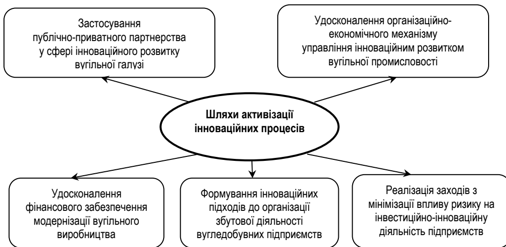
Рис. 1. Напрями активізації інноваційного розвитку вітчизняної вугільної галузі*

2. Напрями вдосконалення та реалізації організаційно-економічного механізму управління інноваційним розвитком вугільної галузі: