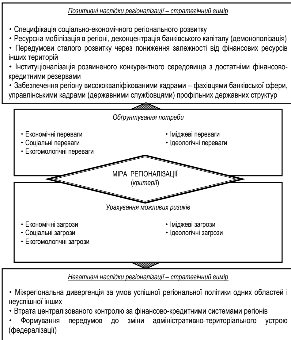
Рис. 1. Основні вектори наслідковості регіоналізації розвитку банківської системи*