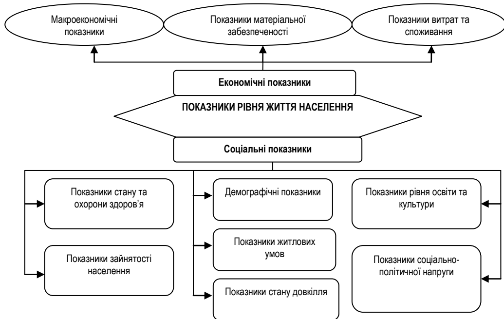
Рис. 3. Економічний блок показників рівня життя населення*