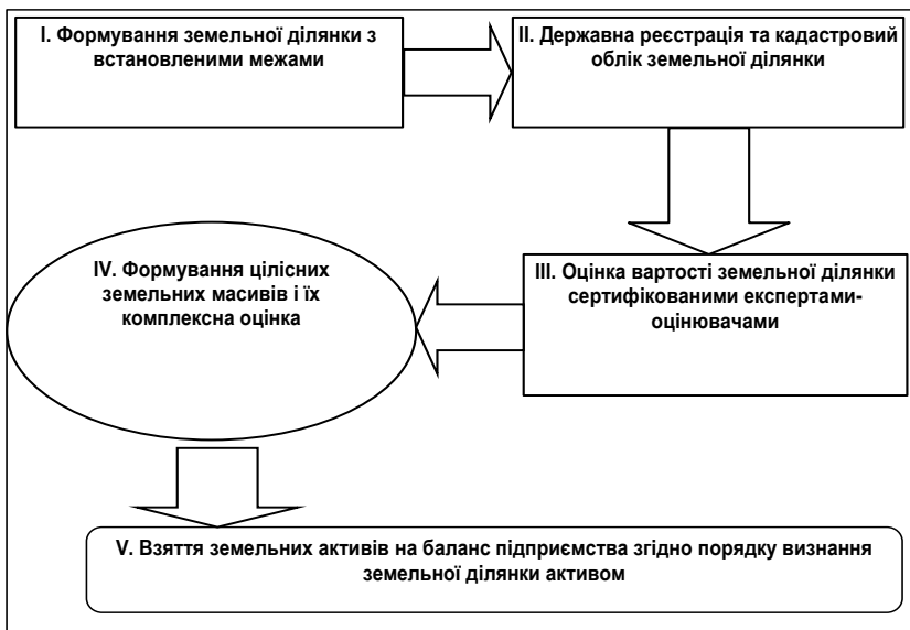
Рис. 2. Алгоритм зарахування сільськогосподарських земель на баланс підприємства та визнання їх активами*

Поряд з кваліфікованою оцінкою земель має відбуватись процес трансформації земельної ділянки в особливий інвестиційний інструмент – земельний актив, основною умовою формування якого є зарахування її на баланс підприємства. Наявне інституціональне середовище на ринку сільськогосподарських земель сьогодні не дозволяє вирішити проблеми товаровиробників щодо взяття земельних ділянок на баланс підприємства. Загалом алгоритм зарахування сільськогосподарських земель на баланс підприємства можна представити у вигляді схеми послідовних етапів (рис. 2).