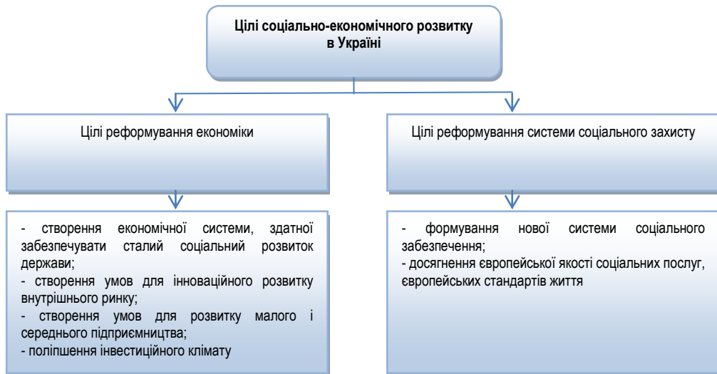
Рис. 2. Основні цілі соціально-економічного розвитку України*

Я. А. Жаліло, С. І. Лавриненко, Д. С. Покришка, ми переконані, що сьогодні цілі соціально-економічного розвитку держави слід вважати найбільш пріоритетними та перспективними, оскільки їх досягнення дозволяє максимально зняти навантаження на бюджет і ефективно вирішувати соціальні проблеми [6].