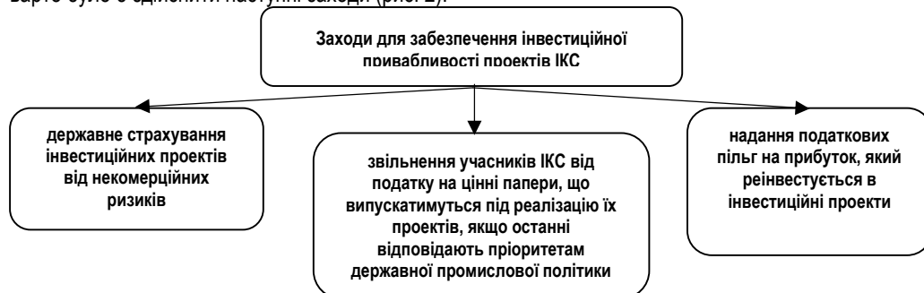
Рис. 2. Заходи для забезпечення інвестиційної привабливості проектів ІКС

Свою чергою зазначимо, що для забезпечення інвестиційної привабливості проектів ФПГ варто було б здійснити наступні заходи (рис. 2).