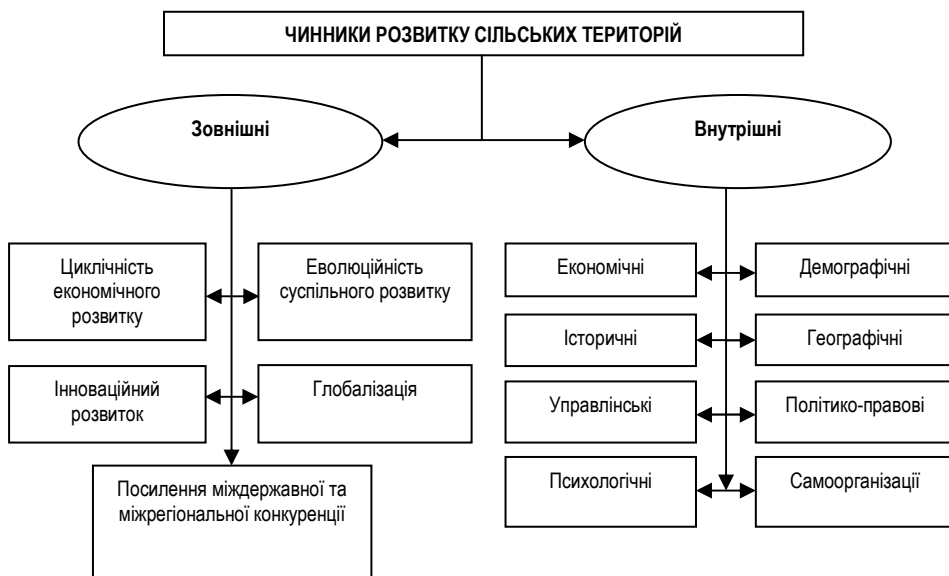
Рис. 1. Чинники розвитку сільських територій в умовах ринку [12, с. 385]

Що стосується їхньої організації, то варто виокремити основні складові елементи, які у подальшому формують сутність, підходи та вектори системи управління і регулювання сільськими територіями.