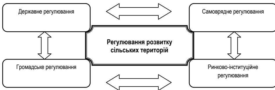
Рис. 3. Регулювання розвитку сільських територій

Залежно від цього, регулювання можна класифікувати на такі види (рис. 3):