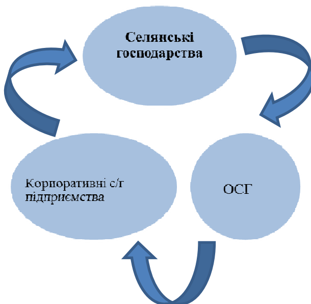
Рис. 2. Розвиток організаційних форм у сільському господарстві Варіант 2*