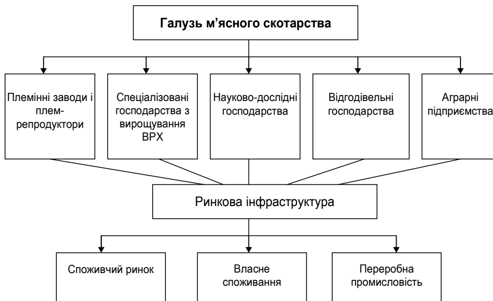
Рис. 3. Структура галузі м'ясного скотарства України*

Узагальнена схема організаційної структури галузі м'ясного скотарства представлена на рис. 3.