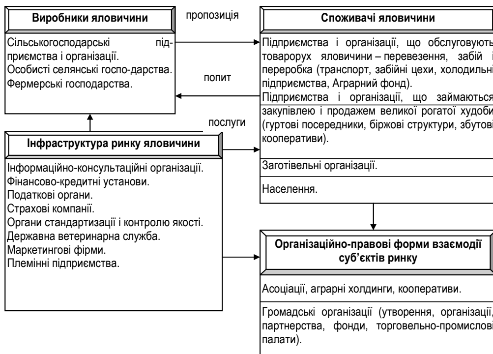
Рис. 2. Організаційне забезпечення функціонування м'ясного скотарства*