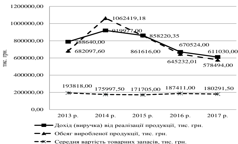
Рис. 1. Динаміка показників господарської діяльності ПАТ «Дніпроважмаш»*

На рис. 1 графічно зображено динаміку виробництва та реалізації виробленої продукції у ПАТ «Дніпроважмаш».