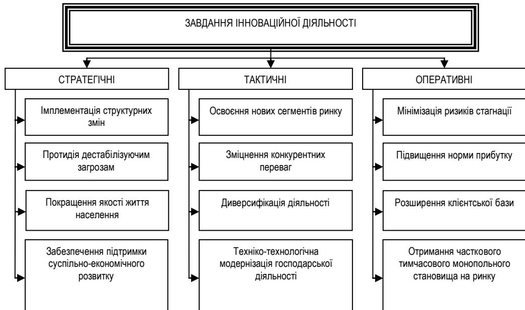
Рис. 1. Структуризація завдань інноваційної діяльності*

стратегічну роль у розрізі всіх сфер суспільно-економічного життя. Важливе місце інноваційна діяльність посідає й у функціонуванні підприємств туристичної галузі, що обґрунтовується не лише потребою в постійному вдосконаленні існуючих технологій задоволення вподобань і потреб споживачів туристичних послуг, але й доцільністю пошуку якісно нових підходів до максимізації отриманого прибутку туристичними підприємствами.