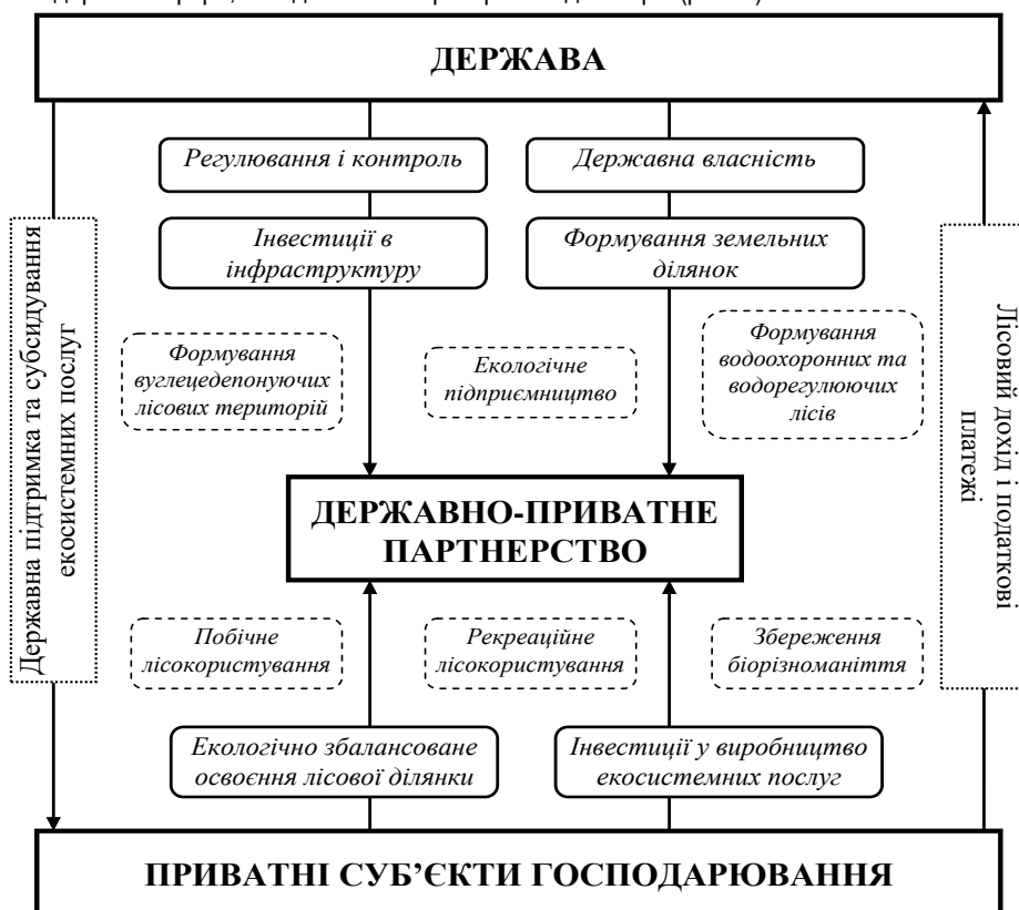
Рис. 2. Схема державно-приватного партнерства у сфері виробництва і реалізації екосистемних послуг лісогосподарської галузі*

В сфері виробництва і реалізації екосистемних послуг лісогосподарської галузі стадії процесу державно-приватного партнерства можуть бути наступними: взаємовпорядкування інтересів держави та приватного сектора щодо лісокористування та реалізації управлінських функцій у цій сфері (еколого-економічний аналіз); виокремлення ключових напрямів у виробництві й реалізації екосистемних послуг лісогосподарської галузі при розробленні програмних документів; розробка результативних проектів із виробництва та реалізації екосистемних послуг лісогосподарської галузі, що ґрунтуються на чинних державних програмах розвитку лісогосподарської сфери, та підписання партнерських договорів (рис. 2).