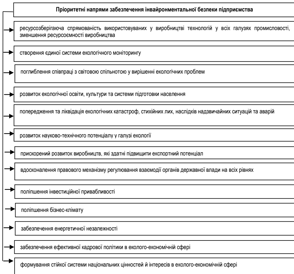
Рис. 2. Пріоритетні напрямки забезпечення інвайронментальної безпеки*

Пріоритетні напрями інвайронментальної безпеки подано на рис. 2.