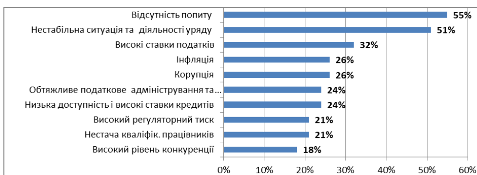
Рис. 2. Проблемні чинники що обмежують зростання бізнесу для молодих підприємців, % (згідно даних результатів з проекту «Щорічна оцінка ділового клімату в Україні: 2016 рік»)*

Варто зазначити, що ці проблеми стосуються всіх вікових груп представників дрібного підприємництва і самозайнятості.