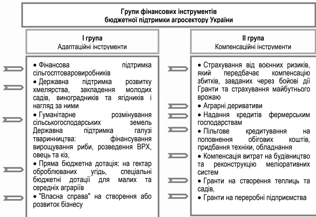
Рис. 2. Групи фінансових інструментів бюджетної підтримки агросектору України та їх структура за бюджетними програмами етапу 2019–2026 рр.*

Аналіз наукових праць [5; 6; 7; 17] та напрямів використання коштів приведеного у табл. 2 переліку програм дає змогу виділити щонайменше дві групи інструментів підтримки: адаптаційні – I група фінансових інструментів, спрямованих на конкретний напрям з метою пом'якшення ризиків та загроз для певної галузі, виду продукції, виокремлено нами за ознакою прямого фінансування з бюджету на конкретні цілі та II група фінансових інструментів компенсаційних, до якої належать інструменти часткової компенсації страхових та кредитних платежів агровиробників, вартості придбання сільськогосподарських машин та обладнання, грантові програми на компенсацію витрат. Розподіл чинних програм за групами фінансових інструментів приведено на рис. 2.