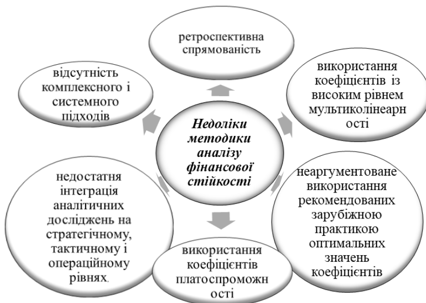
Рис. 1. Основні недоліки чинної методики аналізу фінансової стійкості підприємства (сформовано автором)

Водночас, попри свої позитивні характеристики, традиційна методика аналізу фінансової стійкості на сьогодні не здатна повною мірою задовольнити інформаційні потреби користувачів через низку важливих, на наш погляд, ознак (рис. 1).